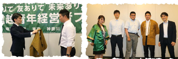
茨城同友会会員数 290名 8月10日理事会時点

※増強活動やイベント開催等、ご意見ご要望をお待ちしております。みんなで茨城同友会の仲間づくり活動を活性化させていきましょう!!